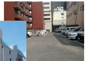
歌舞伎町第8・第9 駐車場 (月極/バイク・車)