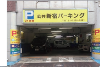
公共 新宿パーキング