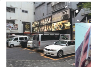
ウエストパーキング 歌舞伎町第3