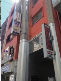
第一オスカービル